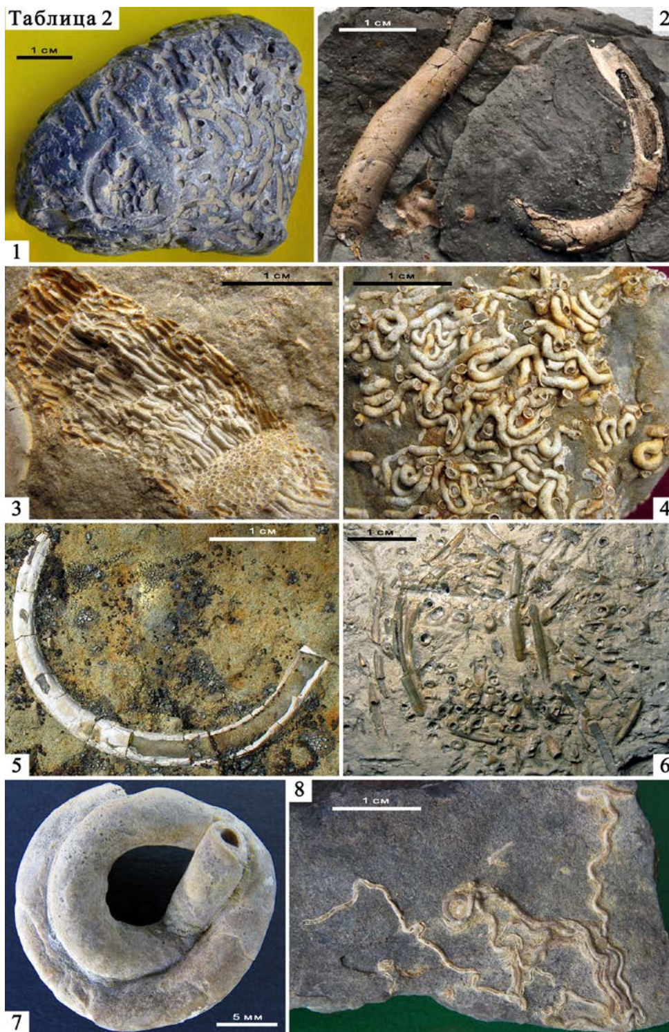
Таблица 2. 1 – полидора ( Polydora sp.), следы сверления на створке грифеи. Юра, оксфордский ярус. г. Сызрань, 2011 г. 2 – серпулида ( Serpulidae gen. indet.), жилые трубки. Юра, кимериджский ярус. г. Сызрань, 2011 г. 3 – филограна общественная ( Filograna socialis ), колония жилых трубок. Юра, волжский регион. Большечерниговский р-н, пос. Краснооктябрьский, карьер, 2012 г. 4 – гломерула сплетающаяся ( Glomerula plexus ). Юра, волжский регион. Большечерниговский р-н, пос. Краснооктябрьский, карьер, 2012 г. 5 – тетрасерпула [ногробс] ( Tetraserpula [Nogrobs] sp.), жилая трубка. Юра, волжский регион. Большечерниговский р-н, пос. Краснооктябрьский, карьер, 2008 г. 6 – тетрасерпула [ногробс] четырёхугольная ( Nogrobs [Tetraserpula] tetragona ), скопление жилых трубок. Юра, волжский регион. Большечерниговский р-н, р. Сестра, 2000-е гг. 7 – гломерула гордиалис ( Glomerula gordialis ), жилая трубка. Юра, волжский регион. Большечерниговский р-н, пос. Краснооктябрьский, карьер, 2005 г. 8 – гломерула ?гордиалис ( Glomerula cf. gordialis ), жилые трубки на раковине двусторчатого моллюска дельтоидея ( Deltoideum delta ). Юра, волжский регион. Большечерниговский р-н, пос. Краснооктябрьский, карьер, 2017 г. Образцы 1, 2 – В.П. Морова (Экологический музей ИЭВБ РАН); 3-8 – СОИКМ.