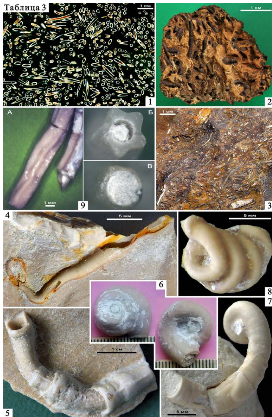
Таблица 3. 1 – тетрасерпула [ногробс] четырёхугольная ( Nogrobs [Tetraserpula] tetragona ), скопление жилых трубок. Полированный срез. Юра, волжский регионарус. Большечерниговский р-н, р. Сестра, 2000-е гг. 2 – тетрасерпула [ногробс] ( Nogrobs [Tetraserpula] sp. ), скопление жилых трубок. Мел, ?барремский ярус. Сызранский р-н, с. Новая Рачейка, 2021 г. 3 – тетрасерпула [ногробс] барремская ( Nogrobs [Tetraserpula] barremicus ), скопление жилых трубок. Мел, барремский ярус. Сызранский р-н, с. Кашпир, 2006 г. 4 – неовермилия бутылкообразная ( Neovermilia ampullacea ), жилая трубка на раковине двустворчатого моллюска иноцерамус ламарка ( Inoceramus lamarcki ). Мел, туронский ярус. Шигонский р-н, с. Климовка, 2010 г. 5 – неовермилия бутылкообразная ( Neovermilia ampullacea ), жилая трубка на раковине двустворчатого моллюска иноцерамус ламарка ( Inoceramus lamarcki ). Мел, туронский ярус. Шигонский р-н, с. Новодевичье, 2019 г. 6 – «дорзосерпула» ( “Dorsoserpula” sp. ), основание жилой трубки. Мел, кампанский ярус. Шигонский р-н, 2016 г. 7 – «дорзосерпула» ( “Dorsoserpula” sp. ), фрагмент жилой трубки. Мел, маастрихтский ярус. Шигонский р-н, с. Климовка, 2016 г. 8 – спирасерпула спирасерпула ( Spiraserpula spiraserpula ), жилая трубка. Мел, маастрихтский ярус. Шигонский р-н, с. Климовка, 2016 г. 9 – пентадитрупа слабозавивающаяся ( Pentaditrupe subtorquata ), А – фрагменты жилой трубки, Б – сечение, В – устье. Мел, маастрихтский ярус. Шигонский р-н, с. Подвалье, 2016 г. Образцы 1, 2, 5 – СОИКМ; 4 – В.П. Морова (Экологический музей ИЭВБ РАН); 6, 9 – сбор с геологических практик СамГТУ; 7, 8 – Р.А. Гунчина.