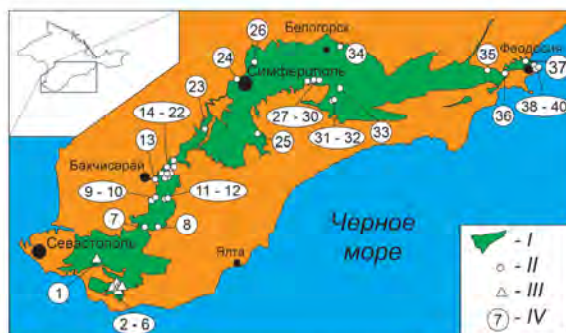
Схема расположения изученных разрезов мела Горного Крыма. I - выходы меловых отложений, II - разрезы, по которым получены палеомагнитные данные, III - разрезы, по которым не удалось получить палеомагнитной информации, IV - номера разрезов (см. ниже).