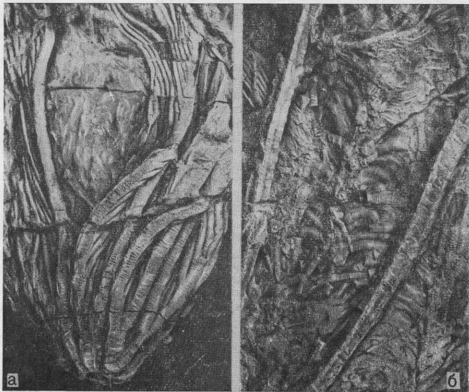
Рис. 2. Остатки Seirocrinus laevisutus из сланцев таврической серии ( \times 0,6 ): а — фрагмент кроны, экз. ИК-16-1, б — поверхность плиты с фрагментами стеблей и циррусов, экз. ИК-16-2; Крым, бассейн р. Марты, плинсбах

4. Долина р. Марты (правый приток р. Качи), в 2 км выше окраины дер. Верхоречье, примерно в 0,5 км выше по течению от высоковольтной линии. Две плитки с хорошо сохранившимися остатками стеб-