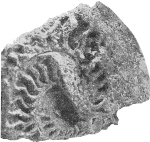
Fig. 4. Exemplar No. 2 der Sammlung des Min. Instituts zu Jena. ca. \frac{1}{2} . (Infolge der Wölbung des Objekts etwas vom Apparat verzeichnet.)