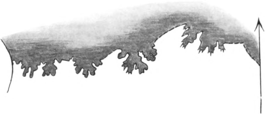
Fig. 6a. Lobenlinie des ZEISS'schen Stückes (wenig verkl.).

näherte bezüglich der Lobenlinie, deren Sattellelemente hier wie dort durch die große Feinheit der einzelnen Teile sich auszeichnen. Auch die Lobenlinie von Pt. fastigatus DIENER 1 käme als Vergleichsobjekt in Betracht, vor allem auch hinsichtlich der von DIENER in der Beschreibung p. 30 erwähnten Dünnstieligkeit der Sättel. Doch ist die äußere Form dieses Ptychites zu verschieden von unserer Art, um den Gedanken an eine nähere Verwandtschaft zuzulassen.