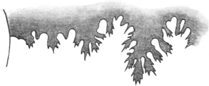
Fig. 5 a. Lobenlinie zu Exemplar No. 5. \frac{1}{4} .

seins des Gehäuses nicht zu machen. Auffällig ist die Schmalheit der Sattелеlemente, die eine ungemein feine Verästelung zeigen.