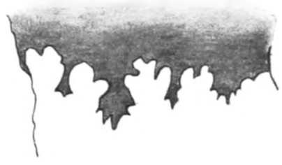
Fig. 2. Exemplar der COMPTON'schen Sammlung. Fundort: Kernberge. ca. \frac{1}{4} .

31 cm. Das Stück zeigt aufs typischste die allgemeine Form von Ptychites und deutlich die Kammerung des innern Umgangs.