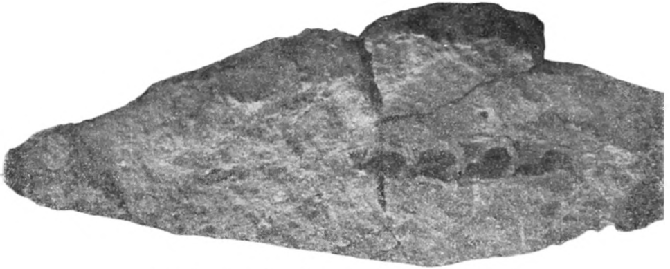
Fig. 3. Aus der Sammlung des Verf. ca. \frac{1}{3} .