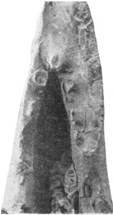
Fig. 6. Exemplar der ZEISS'schen Sammlung. ca. \frac{1}{3} . Fundort: Kernberge.

Die Variation der einzelnen Suturen ist hier sehr deutlich, vor allem, was Stellung, Zahl, Anordnung sowie Ausbildung der feinen Endigungen der Loben, auch Form, Größe etc. der Sättel und ihrer Elemente anbetrifft. Die Breite der Lateralloben beträgt im Mittel 1,9 cm, ihre Breite 2,5. Die Maße der Auxiliarloben schwanken zwischen 1,4 und 2,5 cm, bezw. 0,1 und 0,5. Die Maßverhältnisse des 1. Lateral-sattels sind nicht zu ermitteln.