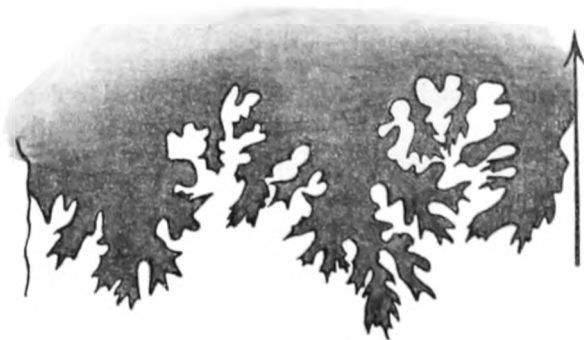
Fig. 4a. (Samml. Exempl. No. 2.) \frac{1}{3} .