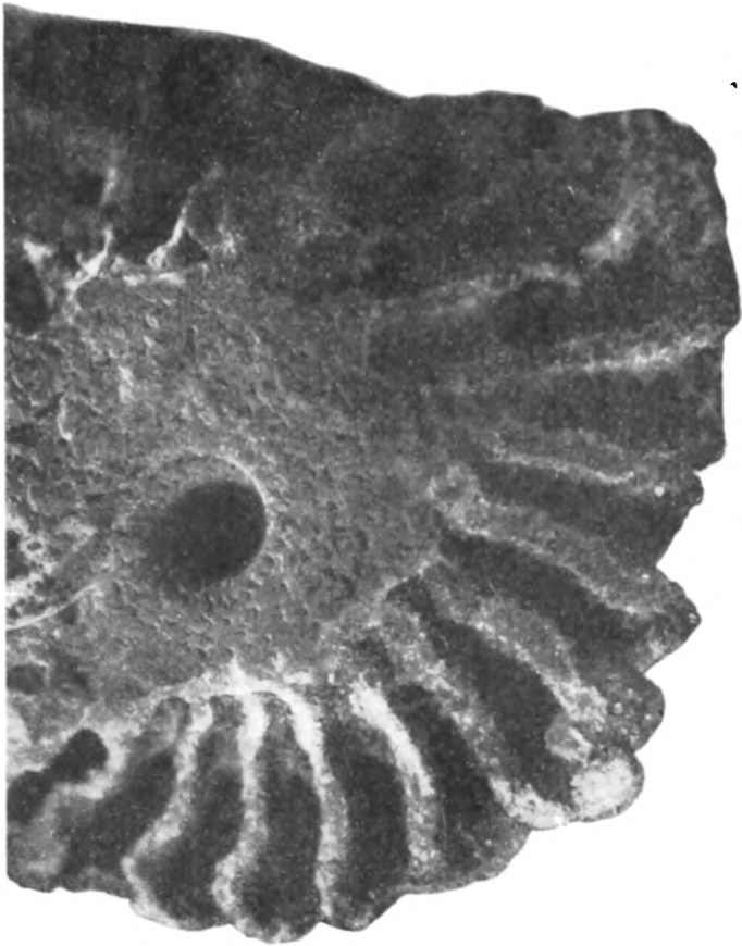
Fig. 1. Sammlungsexemplar No. 1. ca. \frac{1}{4} .