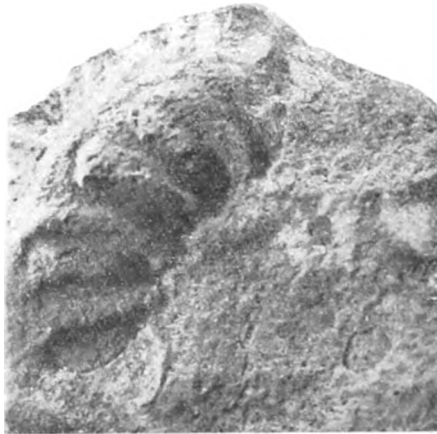
Fig. 7. Arniotites Schmerbitzii . Fundort: Cospeda b. Jena. ca. \frac{2}{1} .