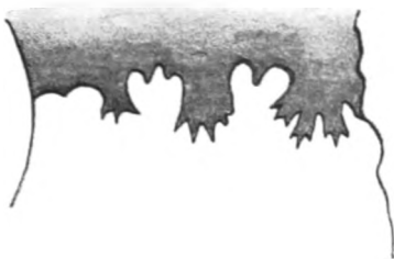
Fig. 1 a. Sammlungsexemplar No. 1. ca. \frac{3}{4} .