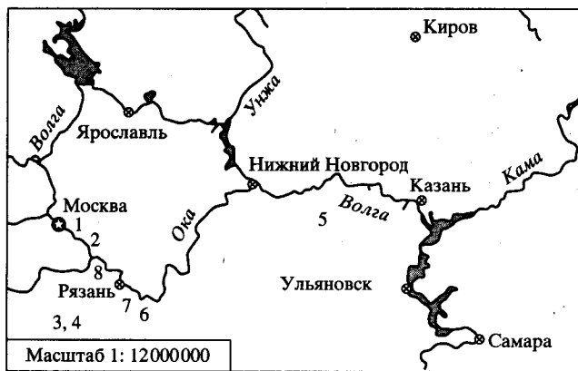
Рис. 1. Схема расположения местонахождений: 1 – карьер у пос. Гжель, 2 – карьер у д. Пески, 3 – карьер завода “Михайловцемент”, 4 – карьер Горенки, 5 – карьер у д. Ужевка, 6 – берег р. Оки возле д. Никитино, 7 – берег р. Раки возле д. Болошново, 8 – берег р. Оки возле д. Алпатьево.

а четыре вида – V. cf. syriaca (Haas, 1955), V. davitashvili Lominadze, 1975, V. salvadori (Tsytovitich, 1911), V. canaliculata (Quenstedt, 1858) – ранее не были известны с описываемой территории. Поскольку объем статьи не позволяет дать описание всех видов, то ниже дано описание только новых таксонов; для остальных приведены лишь изображения.